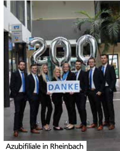
Azubifiliale in Rheinbach