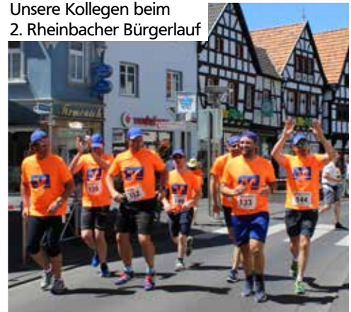
Unsere Kollegen beim 2. Rheinbacher Bürgerlauf