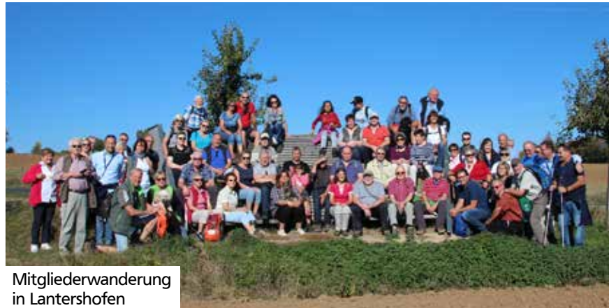
Mitgliedervandierung in Lantershofen