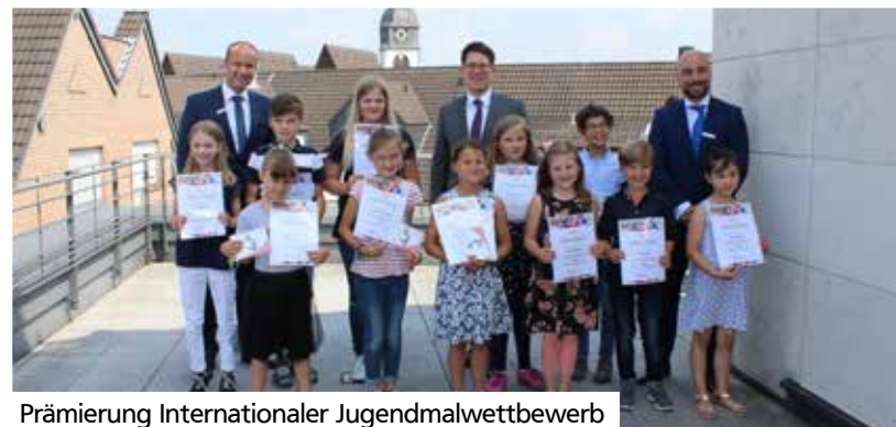
Prämierung Internationaler Jugendmalwettbewerb