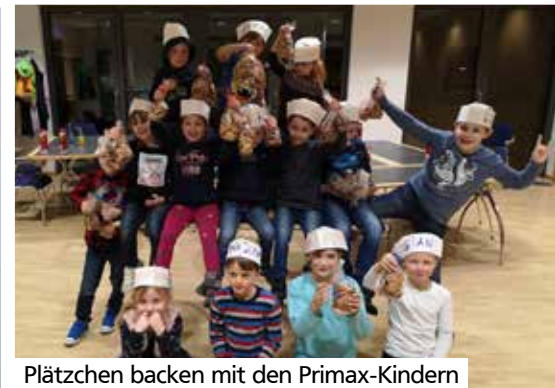
Plätzchen backen mit den Primax-Kindern