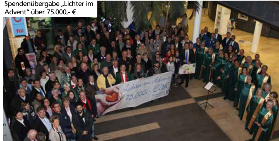
Spendenübergabe „Lichter im Advent“ über 75.000,- €

Mit Spenden von über 170.000,- € und vielen weiteren Aktionen waren wir auch im Jahr 2018 für unsere Mitglieder und Kunden aktiv.