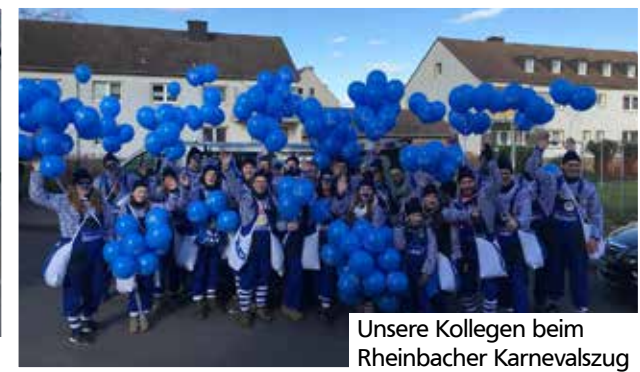
Unsere Kollegen beim Rheinbacher Karnevalszug