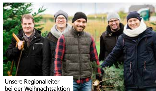
Unsere Regionalleiter bei der Weihnachtsaktion