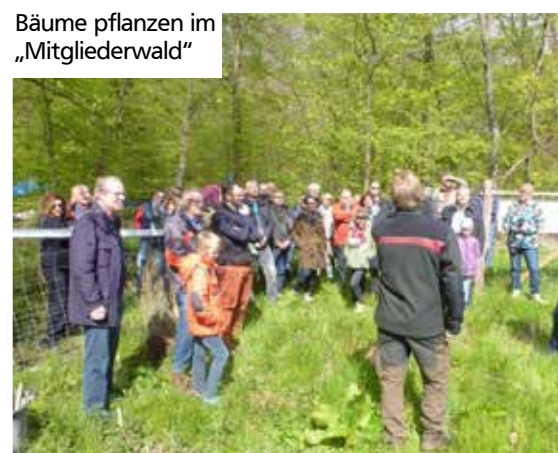
Bäume pflanzen im „Mitgliederwald“