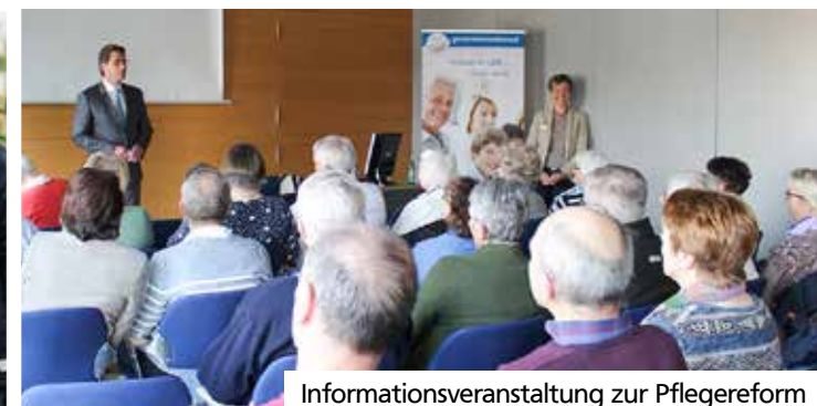
Informationsveranstaltung zur Pflegereform