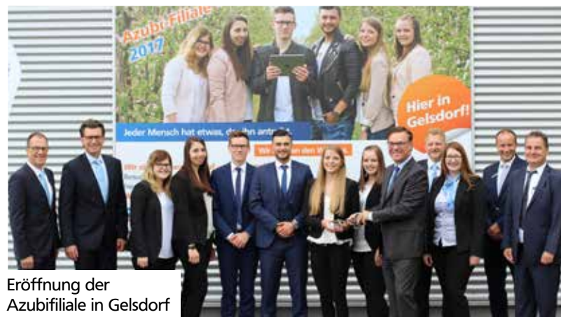
Eröffnung der Azubifiliale in Gelsdorf