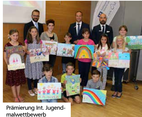
Prämierung Int. Jugendmalwettbewerb