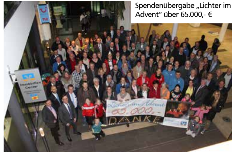
Spendenübergabe „Lichter im Advent“ über 65.000,- €

Mit Spenden über 170.000,- € und vielen weiteren Aktionen waren wir auch im Jahr 2017 aktiv für unsere Mitglieder und Kunden.